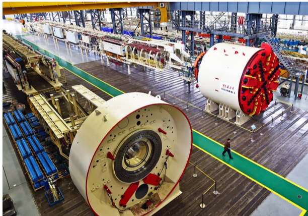
中信重工牡丹系列盾构机加紧组装