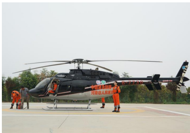
通用航空无人机飞行基地