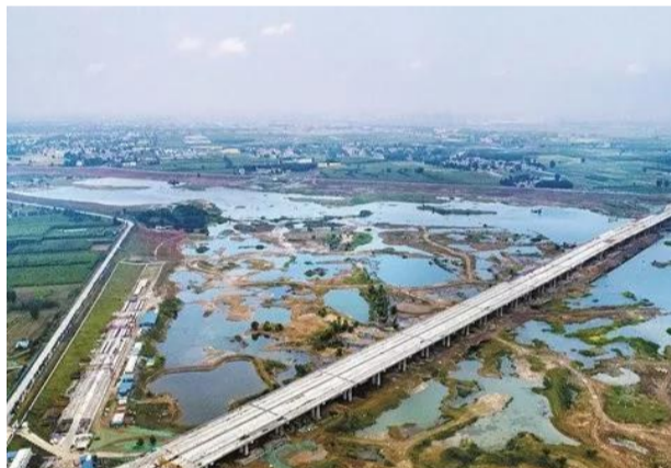
汉魏大道跨伊河大桥

项目建设例会始于2011年前后的全区联审联席会议,虽然会议也邀请了国土、规划、建设等对口职能科室参