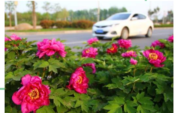
孝文大道两侧牡丹怒放