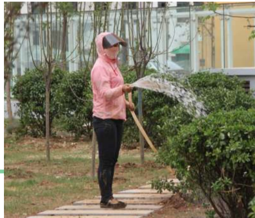
10号小区内部植树造绿