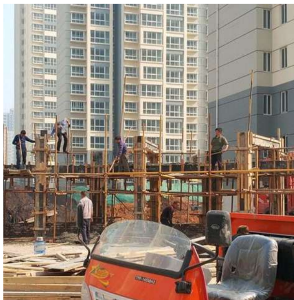
室外工程加紧推进

李平安表示,我们将紧盯目标任务,挂图作战,发扬“白+黑”“5+2”“好+快”、只争朝夕搞建设的精神,以“钉钉子”“剥洋葱”“透骨竿”的劲头,攻坚克难,一个一个求突破,一项一项抓落实,干出实效、干出成绩、干出作风,用努力工作置换安置小区建设新面貌,向区党工委、管委会和涉迁群众交出一份合格答卷。(王振华 侯婕)