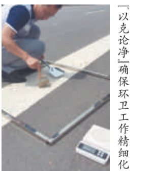
「以克论净」确保环卫工作精细化