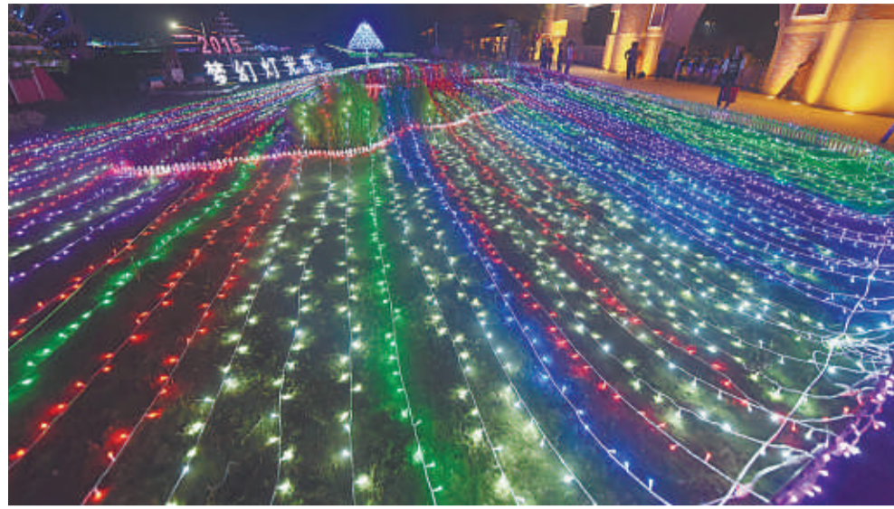
灯光秀、泡沫消暑节、七彩洋伞节……薰衣草庄园开园以来举办的各类活动已成为我区一张特色旅游名片