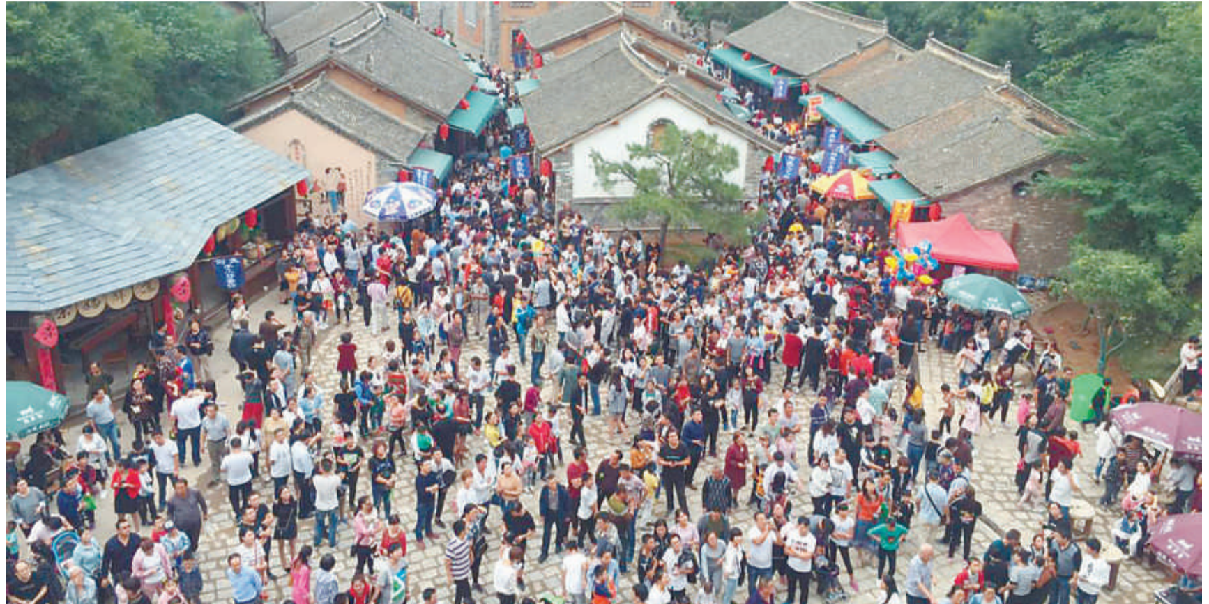
今年十一黄金周新开业的倒盖民俗文化村人流火爆

五年来，我区紧紧围绕建设洛阳近郊最佳文化生态旅游目的地的目标，旅游产业发展取得积极成效。目前，万安山山顶公园、七彩大峡谷、郁金香花海、野生动物园、薰衣草庄园、倒盖民俗文化村等12个景区建成开园。万安山山顶公园全国滑翔伞大赛、中秋拜月大典、丝路风情节、郁金香花海明星演唱会、万国花博会、冰雪大世界、薰衣草庄园灯光节、洋伞节、梦幻花海等让人目不暇接，流连忘返。同时，各景区积极参与全市文明旅游主题广场活动、媒体采风活动、河洛文化展销活动、中原旅游商品博览会等各类旅游推介活动，充分展示了我区旅游产业的发展，扩大了我区旅游产业的影响力。