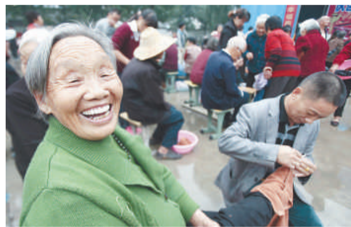
近年来，我区举办的给老人洗脚、寿星宴、慰问、城市清洁、书画送祝福等各类志愿服务活动深入人心