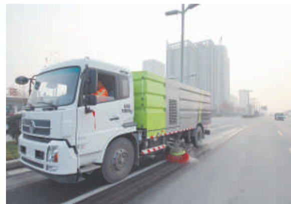
我区道路养护工作进入机械化时代