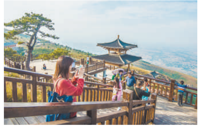
万安山山顶公园已成为市民近郊旅游的好去处