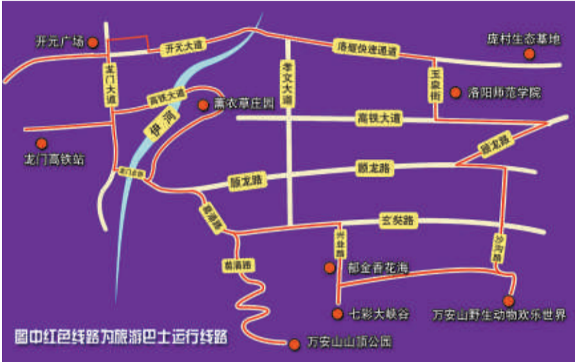
伊滨旅游线路地图