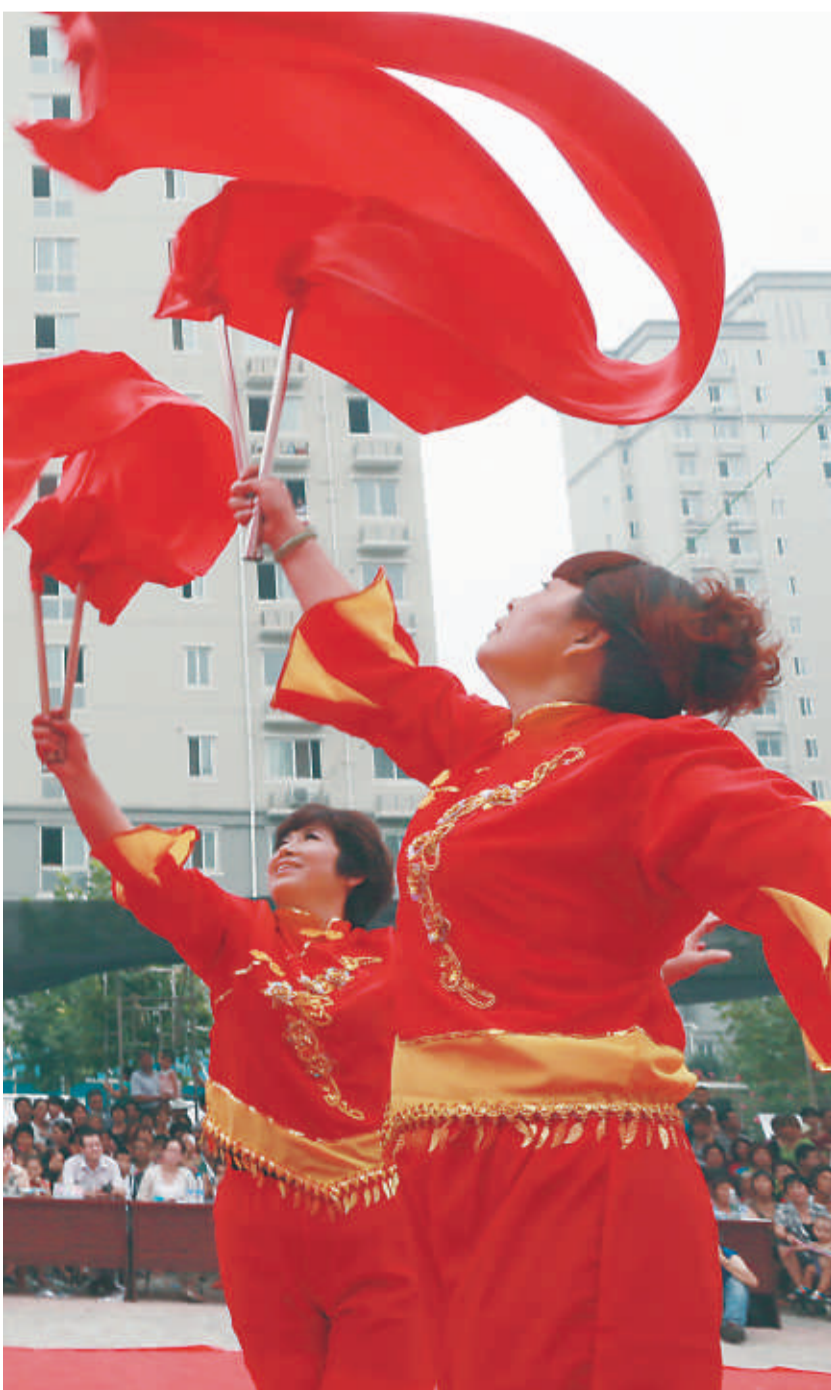
近年来，各类文艺演出进社区、进农村，丰富了群众的业余文化生活