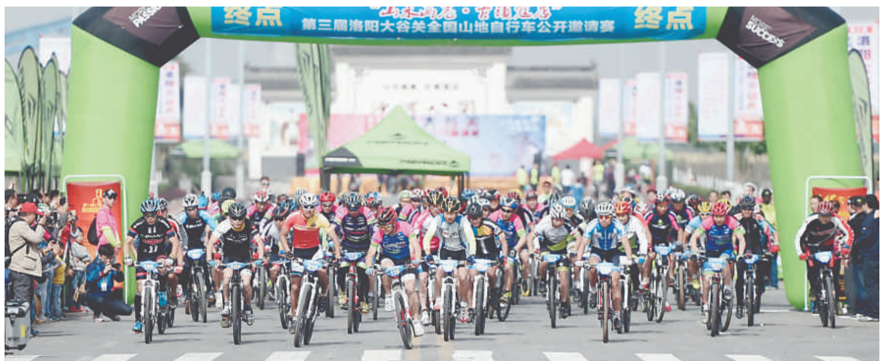
2014年至今，寇店镇已连续举办四届山地自行车赛，吸引全国众多选手参赛