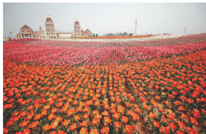
2016年4月，郁金香花海项目内千万株郁金香盛装怒放

五年来，我区采取道德大讲堂、小讲堂、大舞台、文艺汇演等形式，在全区各行各业广泛开展“文明我先行”主题教育系列活动，引导发动群众投身到文明创建之中；以大讲堂和小讲堂为主要形式，全面实施道德讲堂“百千万工程”，广泛开展文明家庭创建活动，传承中华传统家庭美德；开展道德模范评选活动，以身边人讲身边事，用身边人教育身边人；立足区、镇、村实际，开展多领域、多层次、多样化的志愿服务活动，志愿组织体系的推动力和凝聚力逐步凸现；严格执行“机械清扫+人工保洁”的作业模式，提高全区环卫工作精细化水平；以道德建设为抓手，广泛开展道德建设和文明村镇创建活动，社会主义核心价值观宣传教育活动如春风化雨，滋润心田。