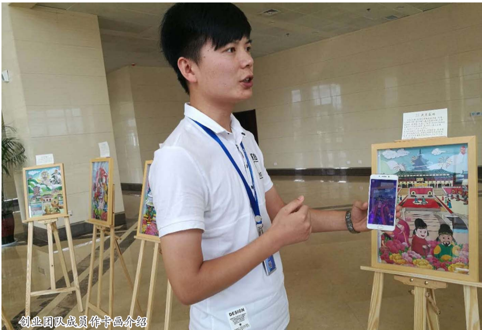
创业团队成员作卡画介绍