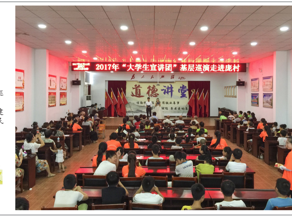
2017年“大学生宣讲团”基层巡演走进庞村