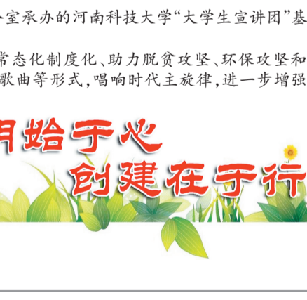
文明始于心 创建在于行

活动现场,大学生们用真情感染观众,用歌声唱响主旋律,以实际行动践行社会主义核心价值观,将党的政策理论唱进了人们的心坎里,现场掌声雷动,气氛跌宕起伏,巡演取得了良好的效果。