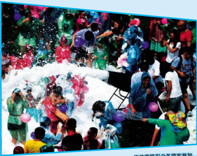
泡沫节吸引众多游客参加