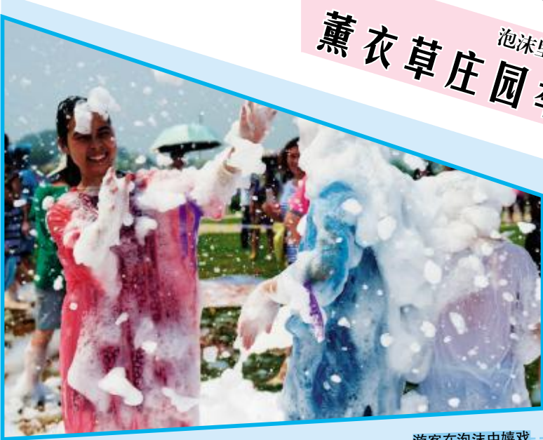
游客在泡沫中嬉戏