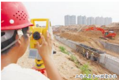
工作人员专心测量方位

伊洛河水生态文明示范区所承载的使命不单单是着眼于“水”,更是“着力打造国家生态休闲示范区、全球华人文化朝圣地、世界旅游度假目的地和国家科技创新中心,成为全市产业发展的‘大脑’”。