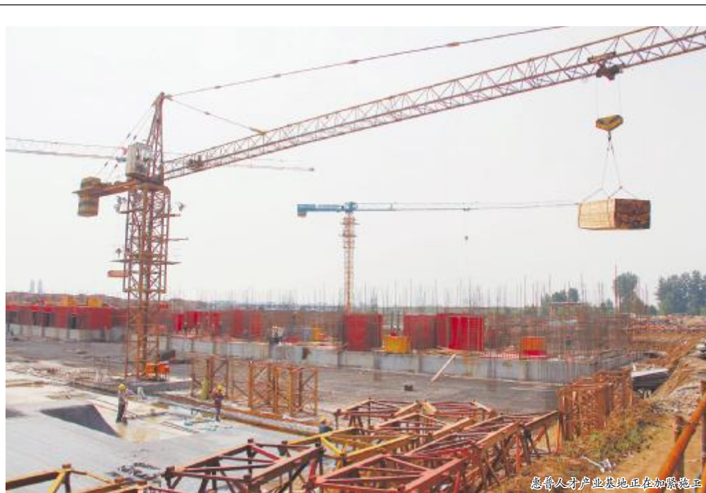
惠普人才产业区正在加紧施工

项目建设的人才实训中心,将为中原地区乃至全国IT产业提供高端人才;软件测试中心及云资源服务中心,将提升我市乃至全省软件外包产业集聚力和IT产业的影响力,为洛阳IT产业招商引资提供支撑;惠普IT孵化器项目投产后,每年可孵化100家左右的小型IT企业。此外,软件测试中心将成为中原地区最大的软件测试平台,投入使用后将快速形成软件区域服务中心,可实现年产值100亿元。项目预计2年投入使用。(杨万通)