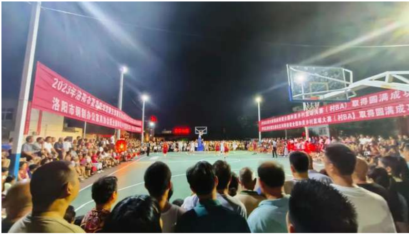
群众的需求连结更紧密,不断拓宽“党建+”服务覆盖面,让邻里中心真正成为“大家庭”,让人民群众感受到幸福生活! (齐琳 张怡珂)

下一步,我区将推动全区各镇持续举办“村际联赛”,送出强势“助攻”,打出精彩“赛事”,以“小篮球”打开“大局面”,推动融文体服务为一体的邻里中心建设与