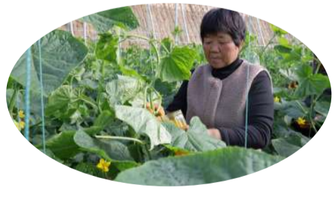
智能化农业产业园项目