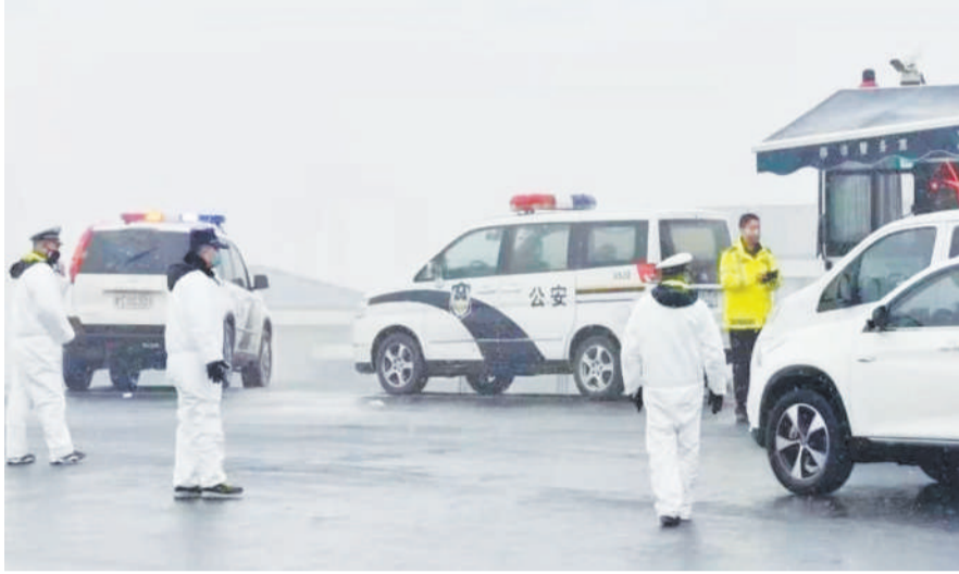
公安: 伊滨公安分局坚决执行上级党委决策部署,广大公安干警舍小家、为大家,坚守岗位,逆行而上,雷厉风行、迅速行动,第一时间启动战时工作机制,举全警之力打好疫情防控阻击战,全力确保辖区治安大局的平稳,保障人民群众生命安全。

核心提示: 新冠肺炎疫情牵动着所有人的心,全国人民正在与疫情进行严肃斗争,为全民抗“疫”凝聚磅礴力量。在这样的特殊时刻,我区公安、交警、医护、扶贫干部等各条战线也涌现出一大批先进人物和先进典型,他们勇于挑最重的担子、敢于啃最硬的骨头,义无反顾投入到这场没有硝烟的战“疫”中,筑起防控疫情、阻击病毒的万里长城。