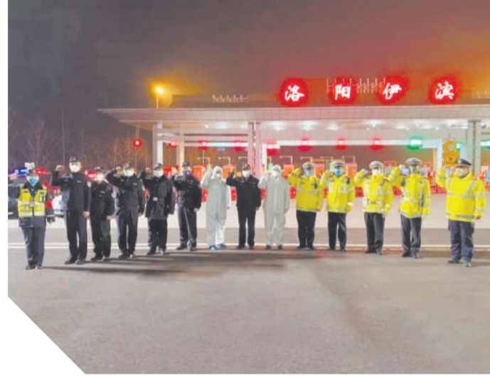
交警: 区交巡大队始终奋战在战“疫”一线,指挥出站车辆有序停车、配合医务检疫人员进行体温检测、对车辆及人员进行登记、保护运送防疫物资安全到达目的地、检查在洛湖北籍车辆运行轨迹……全天候进行交通检查管制,对辖区重点车辆、驾乘人员进行严密排查,全力应对疫情,筑牢疫情联防联控防线。