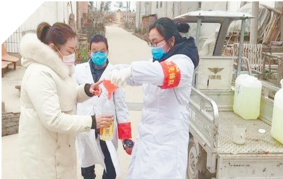
医护: 医护人员担负着全区群众的预防和医疗工作,在此次疫情防控工作中,他们坚守疫情防控“桥头堡”,默默奉献、任劳任怨,保障了一方百姓的健康安全。医护人员既是“排查员”,每天上门排查湖北返乡人员,并为排查对象测量体温;同时又是“宣传员”,利用各种途径向群众广泛宣传新型冠状病毒感染的肺炎的预防常识;他们还是“物资员”,上门向村民发放口罩、体温计、消毒液等物资;甚至他们还是“守门员”,坚守在工作一线。