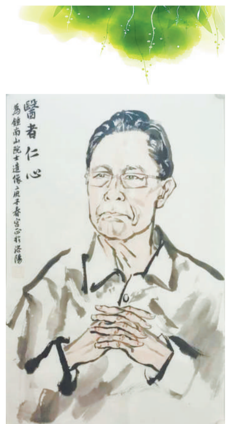
伊滨区美术家协会理事官艺作品《医者仁心》