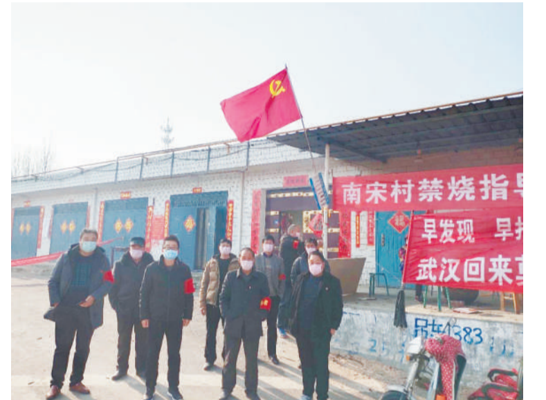
扶贫干部: 在我区阻击疫情的战场上,建档立卡贫困户化身“志愿者”,为隔离户、垃圾堆放点等场所进行消毒,成为政府排忧解难的“好帮手”。驻村“第一书记”深入一线靠前指挥,化身“抗疫战士”,村里做好“四包一”工作的同时,和村里的党员干部一起开展疫情监测、排查、预警等工作,和村内党员干部一起坚守岗位,守护群众生命健康安全。