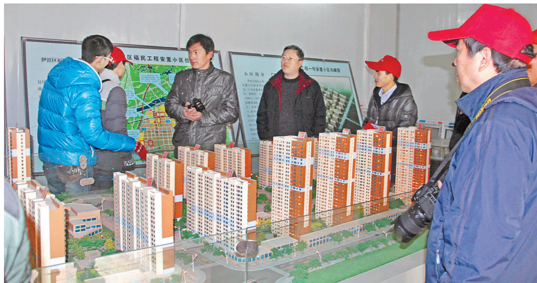
图为网友参观安置小区沙盘。