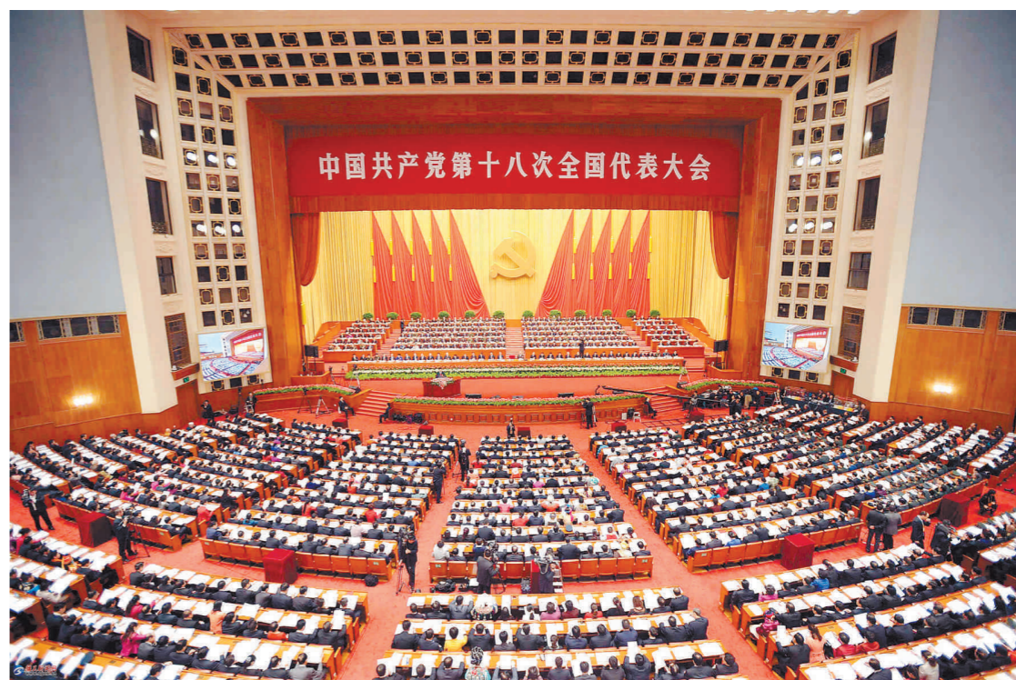
中国共产党第十八次全国代表大会会议现场。