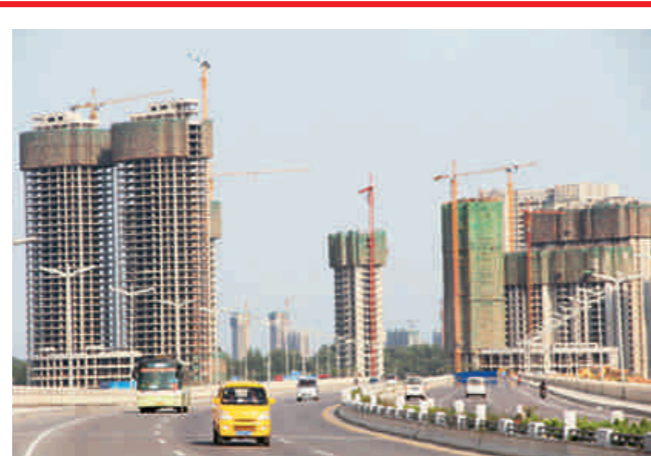
座座商业楼盘拔地而起。

安置小区加紧建设。已开工高层福民安置小区7个,总面积316.8万平方米,在建183栋楼,累计完成投资36.3亿元。其中,福民工