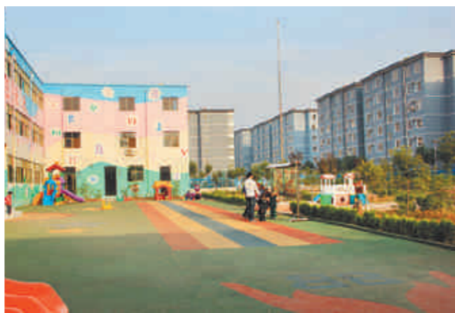
新型农村社区成绩显著,图为和谐社区一角。

程1号安置小区49栋楼主体全部封顶,正在进行装修安装及管网配套建设。 职教园区形象初显。首批已入驻学校6所,总占地4108亩,总建筑面积117万平方米,总投资34亿元。9月初,河南枫叶国际学校、洛阳华洋国际学校等4所学校首批新生已开学;洛阳师范学院项目一期工程已经封顶,首批学生即将入驻。