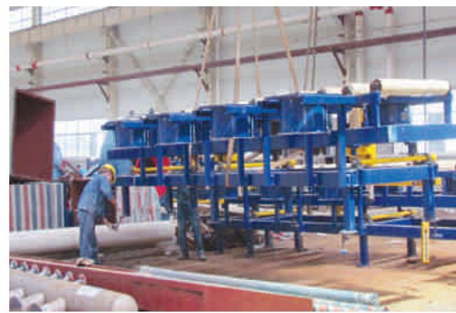
重大项目分批落地,洛阳麦达斯铝业即将试生产。