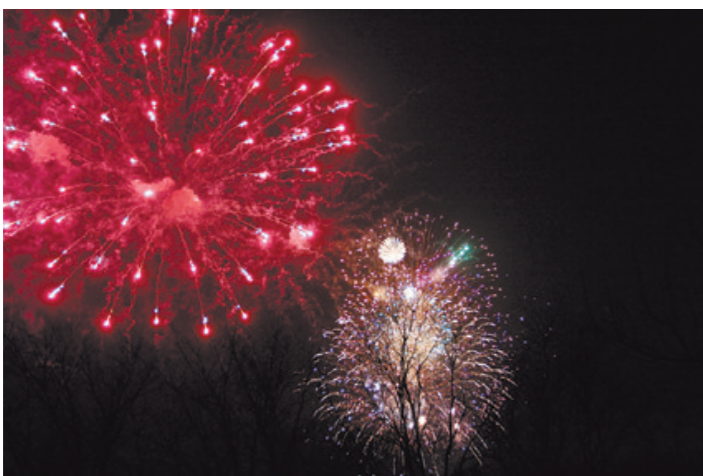
银树火花